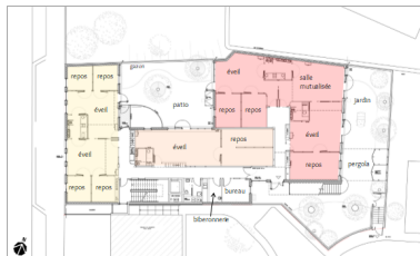
Plan rez de jardin

Unité des grands Unité des moyens Unité des petits Unité des tout petits