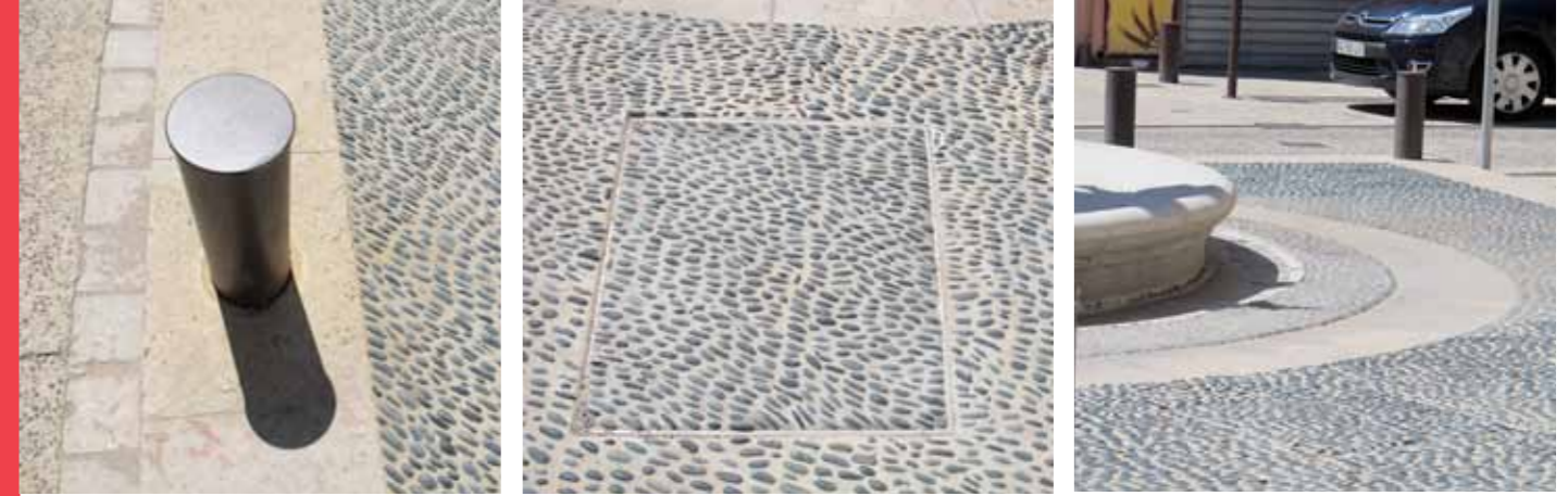
Un soin particulier a été apporté à l'ensemble des détails comme la réalisations des regards, les entourages d'arbres, l'intégration des containers à ordures ménagères, l'implantation du mobilier urbain...