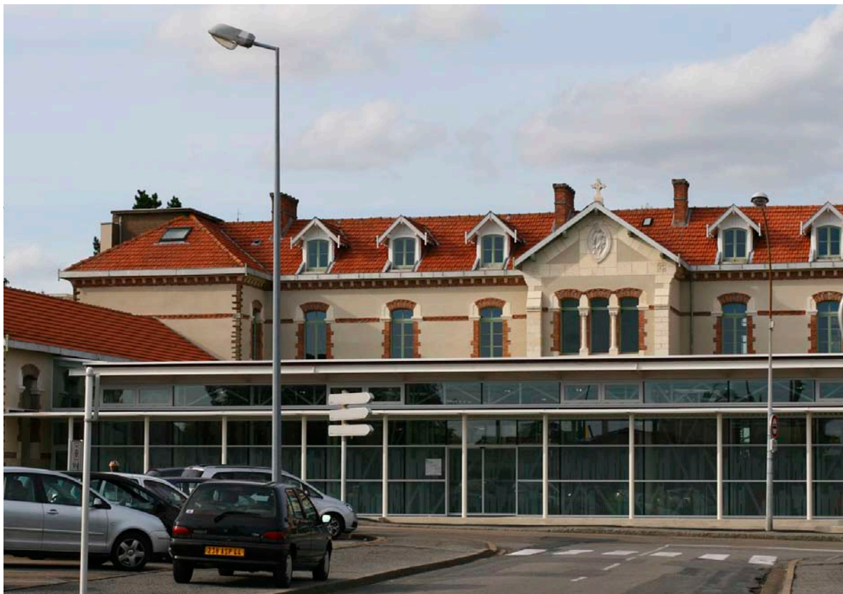
Photographie : X. MENARD et P. WEIGNEN, architectes

À l'issue de 18 mois de travaux, la médiathèque de Vertou a été inaugurée début septembre, avec le concours de Nantes Métropole.