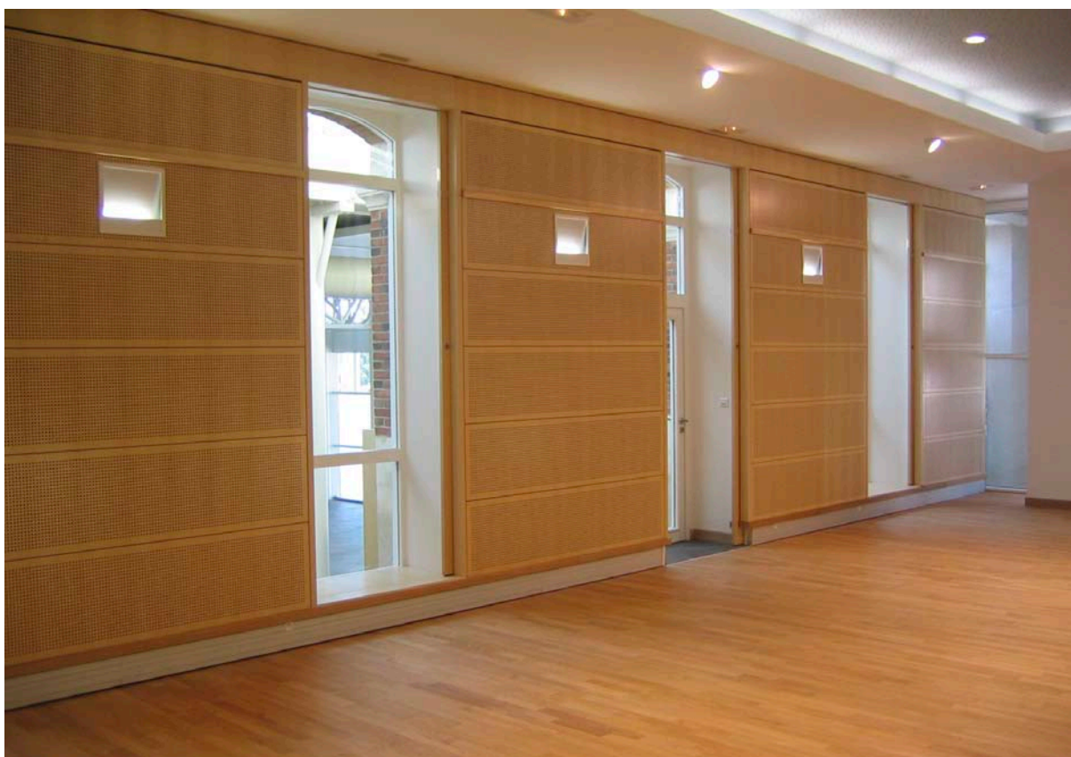
Photographie : X. MENARD et F. MEIGNEN, architectes