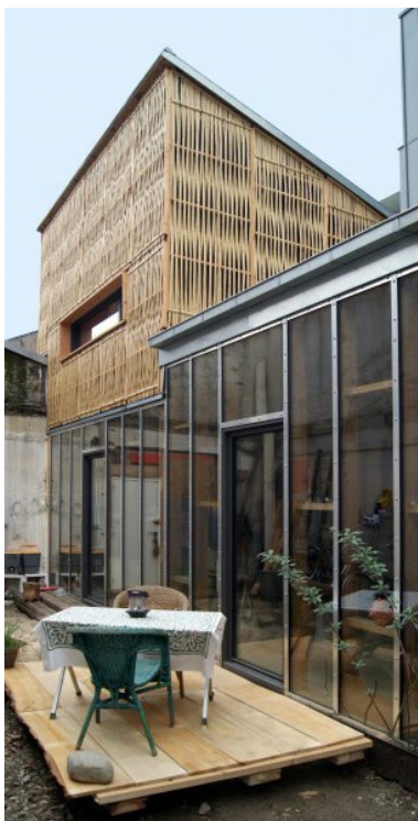
Terrasse et jardin sans les plantations