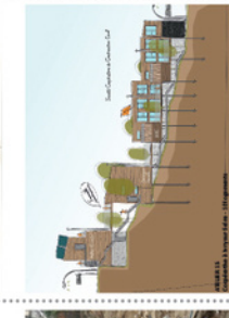
COOP COTEAU - 10/11/2013 - 10/11/2013