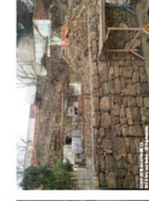
COOP COTEAU - 10/11/2013 - 10/11/2013