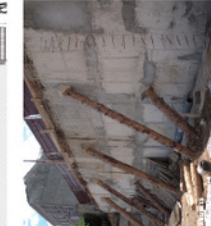
COOP COTEAU - 10/11/2013 - 10/11/2013