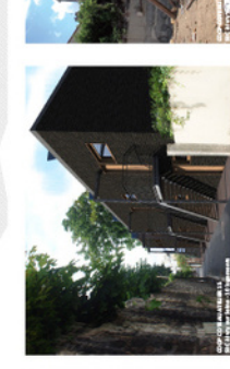
COOP COTEAU - 10/11/2013 - 10/11/2013