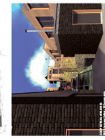
COOP COTEAU - 10/11/2013 - 10/11/2013