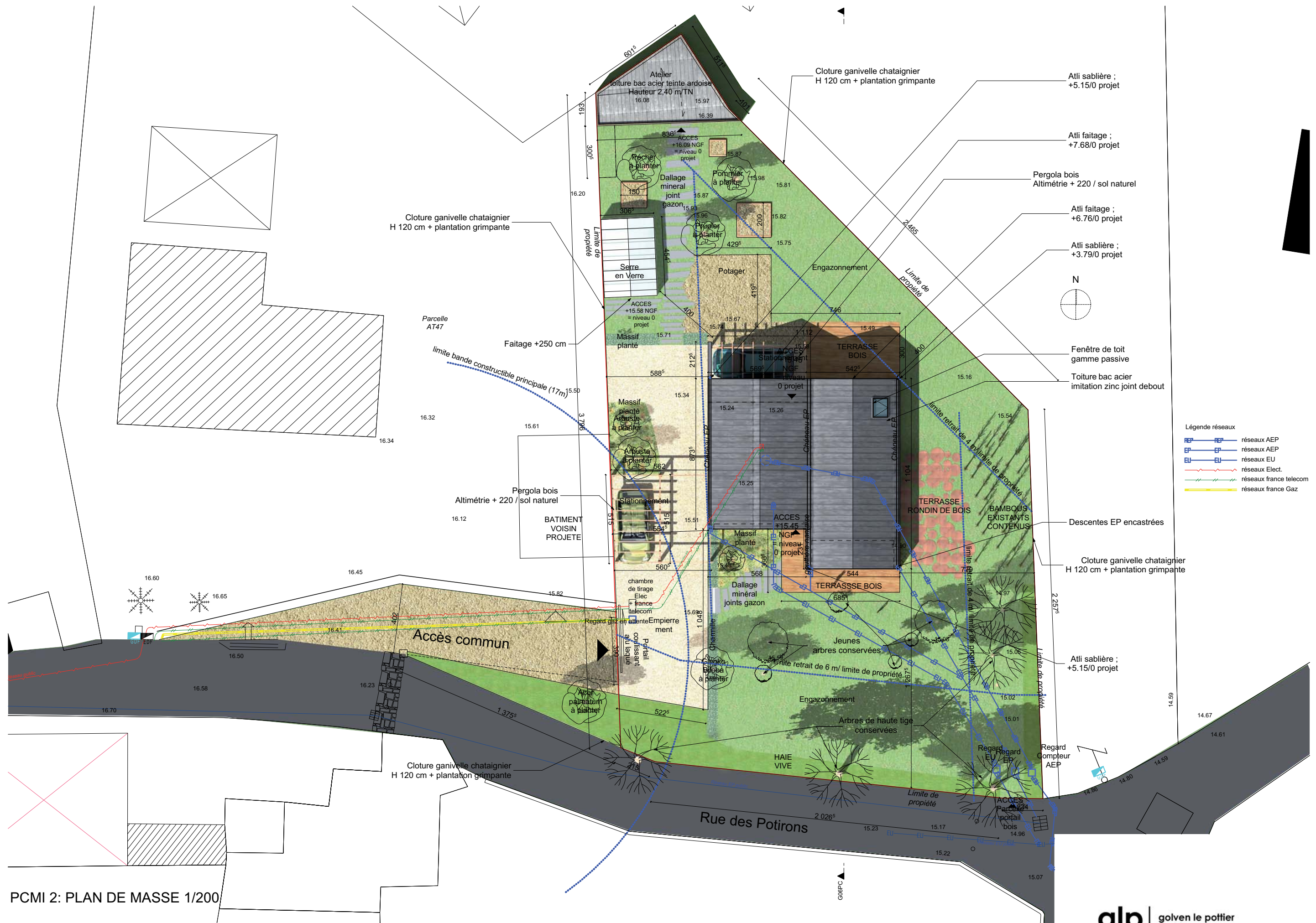
PCMI 2: PLAN DE MASSE 1/200