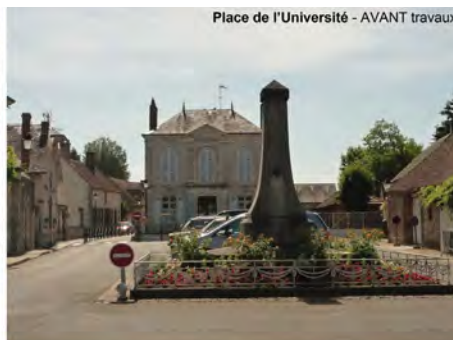
Place de l'Université - AVANT travaux