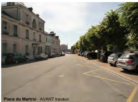
Place du Martroi - AVANT travaux